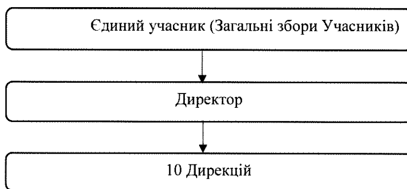
Рис.2 Спрощена організаційна структура.

Спрощена організаційна структура управління материнською компанією наведена нижче в рисунку 2.