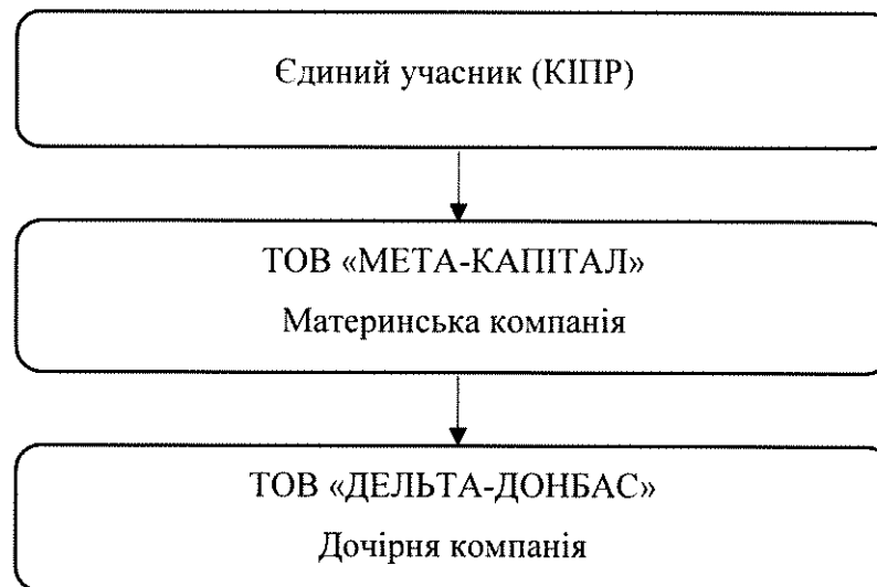
Рис.1 Схема структури групи.