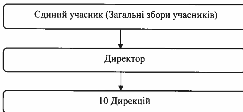
Рис.1 Спрощена організаційна структура.

Спрощена організаційна структура наведена нижче в рисунку 1.