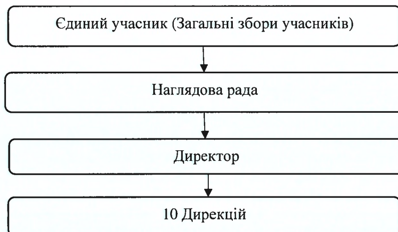
Рис.2 Спрощена організаційна структура.

Спрощена організаційна структура управління материнською компанією наведена нижче в рисунку 2.