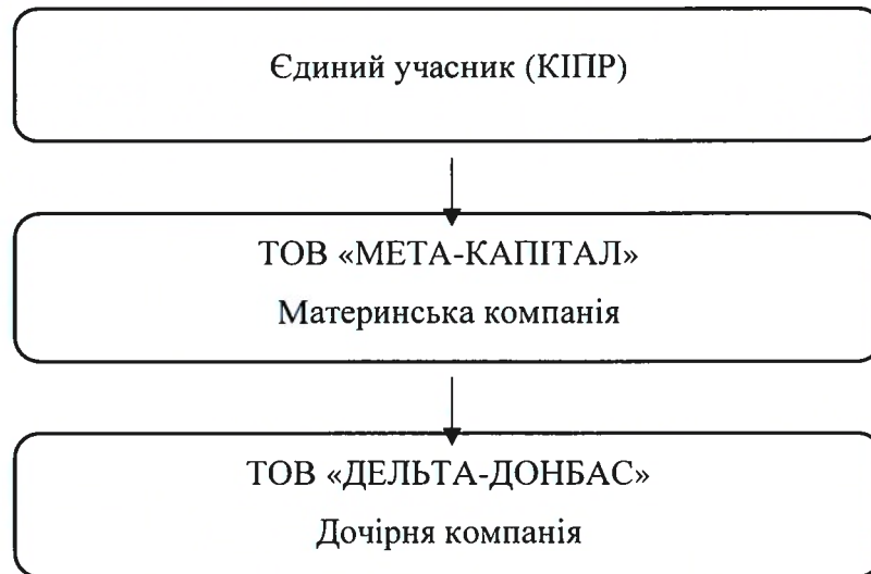
Рис.1 Схема структури групи.

Вищим органом материнської компанії є Загальні збори учасників в особі Єдиного учасника, що визначають основні напрямки діяльності Компанії. Згідно Рішення Єдиного учасника Товариства № 48 від 22.11.2023 створено Наглядову раду Товариства у кількості 3 (трьох) осіб.